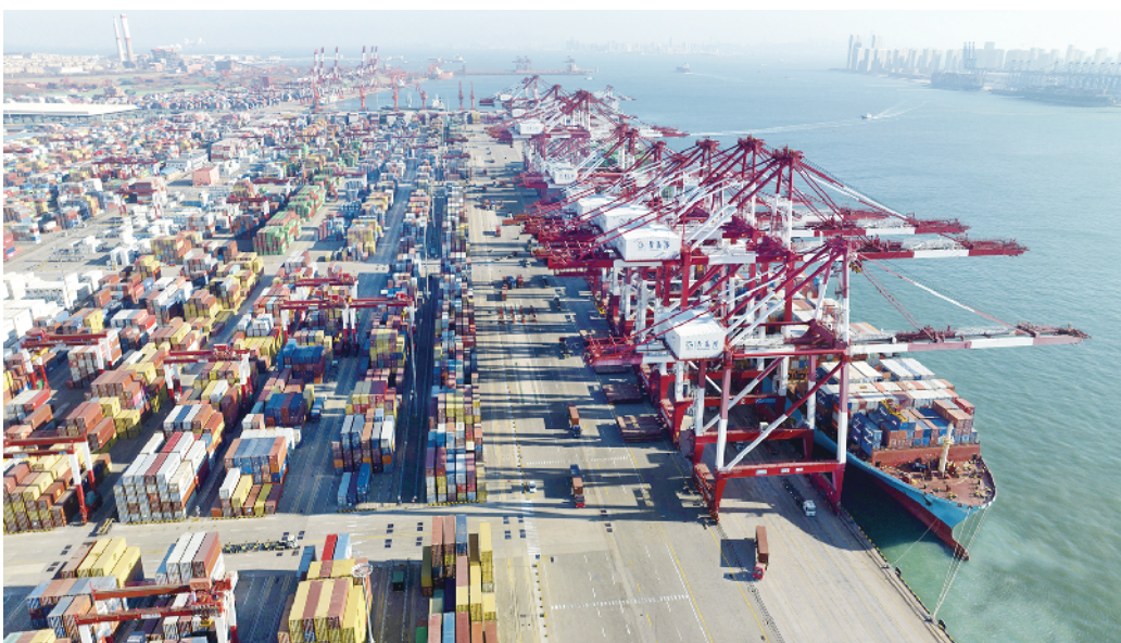
繁忙的青岛港前湾集装箱码头(1月27日摄,无人机照片)。

启运港退税政策项下,对启运港而言,从启运港出发的外贸集装箱货物直接退税,出口企业缩短退税周期,加速资金周转,更愿意就近从启运港办理出口,实现出口企业和启运港的“双赢”。对离境港而言,从启运港出发的外贸集装箱货物,只有通过相应的离境港离境,方可在启运港申请办理出口退税,大大增加了离境港的中