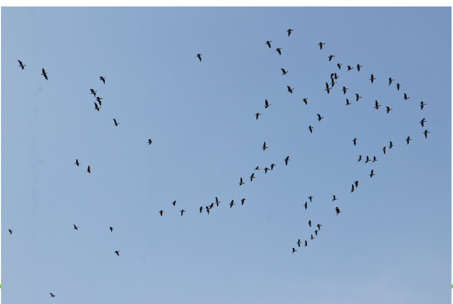
永吴公路上空大雁舞翩跹。