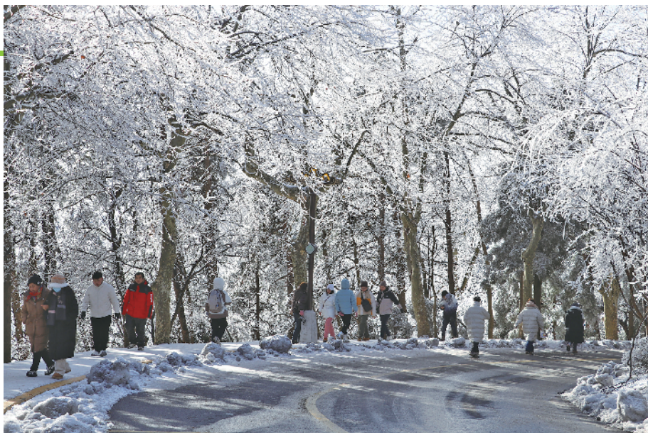
庐山出现雾凇景观,吸引游客前来赏景。