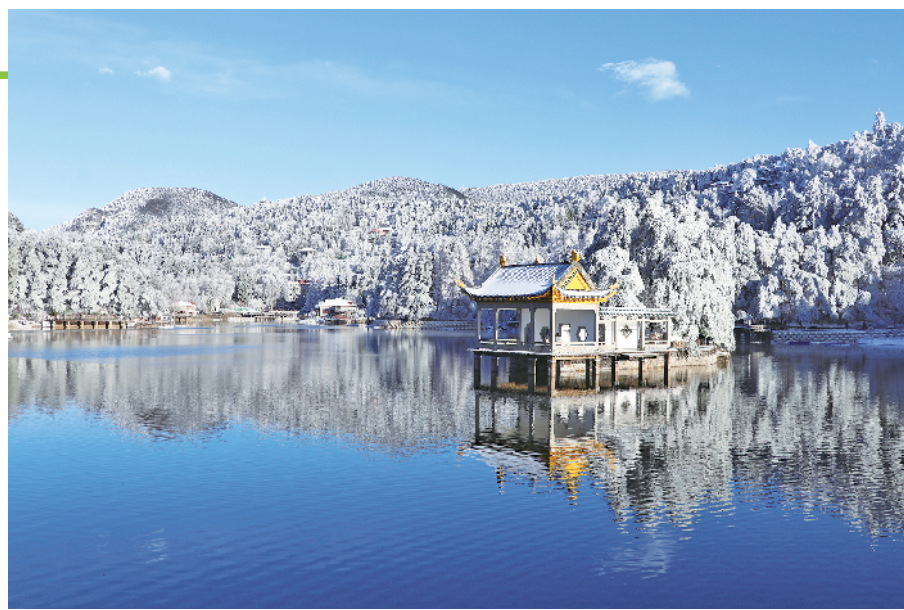
雪后的庐山银装素裹,美景如画。