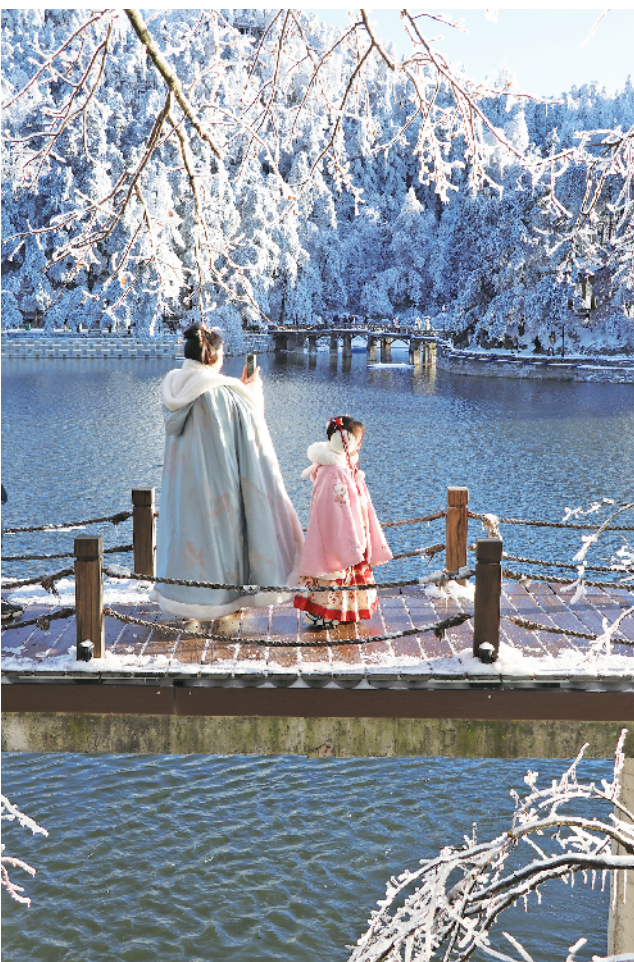
游客在庐山景区欣赏南国雪景。