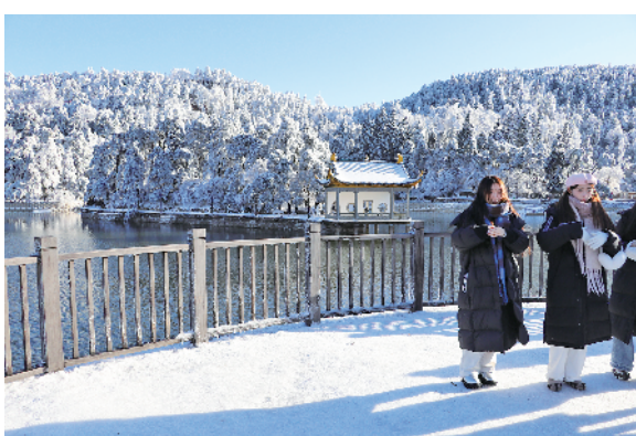
冰雪庐山,吸引游客前来打卡拍照。