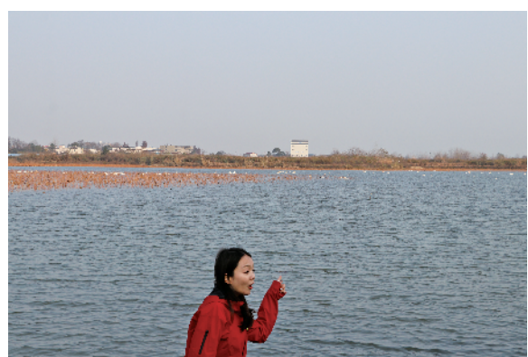
快看,东湖来了好多小天鹅。