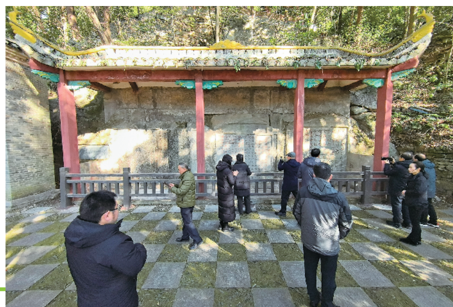
游客在参观庐山秀峰摩崖石刻。