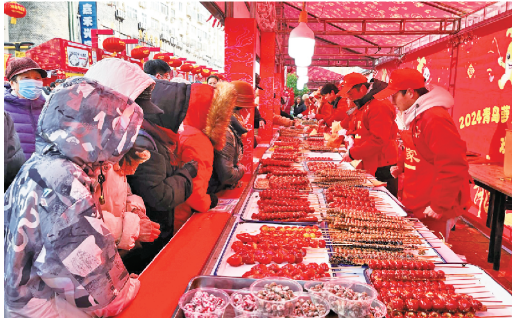
在青岛萝卜·元宵·糖球会上,餐饮摊位前聚满了市民和游客。

2024年青岛萝卜·元宵·糖球会创新设置大鲍岛文化休闲街区(联动台东步行街)和海云庵(联动中车四方机车公园)多个会场,这是首次在历史城区设置会场,不少市民因青岛萝卜·元宵·糖球会第一次走进大鲍岛。以节会为媒,更新升级后的海云庵、四方机车公园也首次曝光,再次“出圈”,不少市民直呼“大变样”。2024年青岛萝卜·元宵·糖球会期间共推出“喜年荟”“国潮荟”“百艺荟”“好市荟”四大板块共43项主题活动和200余项街道社区民俗文化活动,同时,联动全区各大商圈、商场举办主题优惠活动促消费,让百姓得实惠。海云庵会场今年首开夜场演出,集合说唱、摇滚等,为年轻人打造一场“国风夜海云”国潮音乐节。潮·手造活动上,巨型剪纸龙、蓝色条幅印染装置、全国名家龙年生肖剪纸作品等吸引了众多市民冒雪参观。为增加手造体验活动的趣味性,主办方还别出心裁推出“盖帮·寻龙诀”互动体验活动。