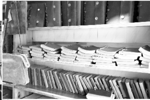
书架上收集来的旧书籍。