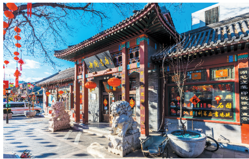
位于北京琉璃厂的中国书店。

种书籍,就给琉璃厂和隆福寺各一家书店通电话,若这家书店中没有该书,店员也会在周边书店中代为寻找。此外,每到周日,北京都会有十余家书店派人给钱穆先生送书。当时他书斋中有一大长桌,书店把每种书的第一二册送来,置于长桌上供他挑选,如果有选中的,下周日书商就把全书带来。但是,钱穆先生选书也有标准,宋元本的高价书绝对不要。他偶尔也有“捡漏”的机会,比如嘉庆刻本的顾祖禹《读史方輿记要》就是在书商不知其价值的情况下廉价购得的。