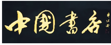
郭沫若题写的中国书店匾额。