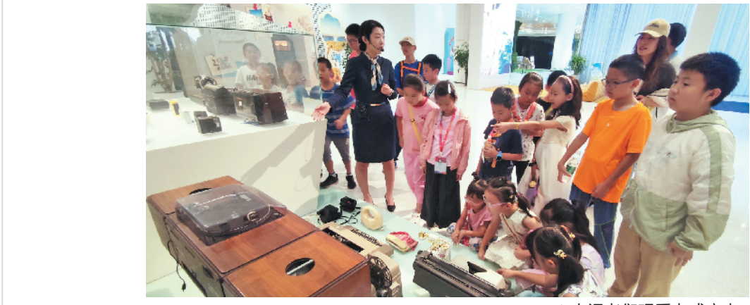
▲讲解员介绍“海尔砸冰箱”的故事。