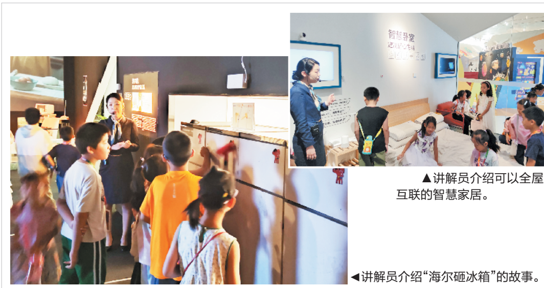
▲讲解员介绍可以全屋互联的智慧家居。

小记者们在讲解员的带领下,参观了老家电陈列区,了解了令人敬佩的海尔品牌故事,体验了充满未来感的智慧家庭展区。小记者们仔细观察每一件展品,认真聆听讲解,不仅增长了知识,也拓宽了自己的视野。