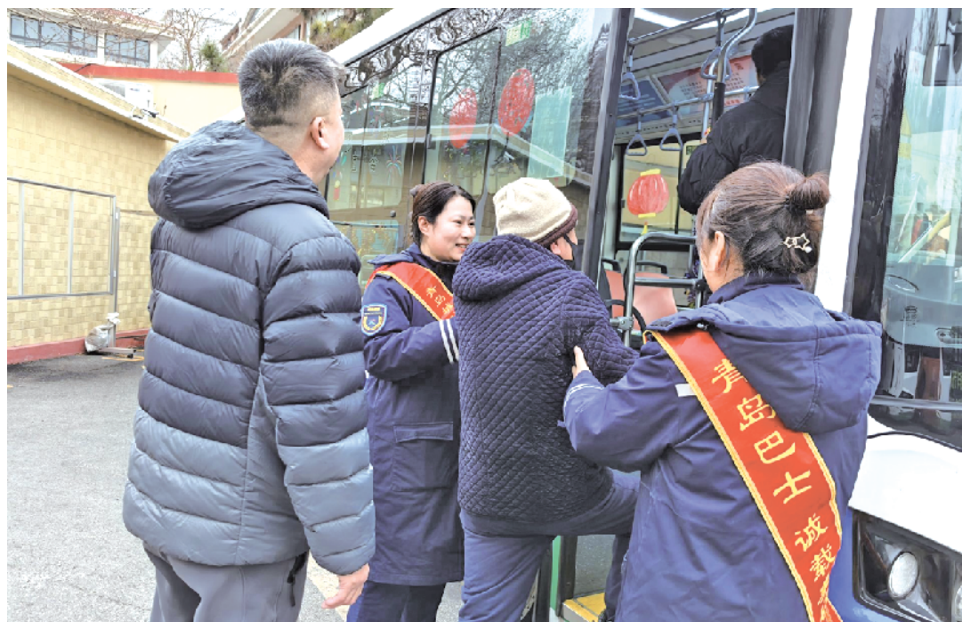
公交市南巴士精准对接居民需求,切实打通服务群众的“最后一米”。

据悉,此次“糖球会直通车”的成功运营,得益于五分公司党支部与延安二路社区党支部的联创共建。自双方党支部建立共建关系以来,始终坚持党建引领与群众路线紧密结合,精准对接居民需求,致力于解决居民出行难题,通过资源共享、优势互补,携手并肩为市民排忧解难,切实打通了服务群众的“最后一米”。此次糖球会出行活动,正是双