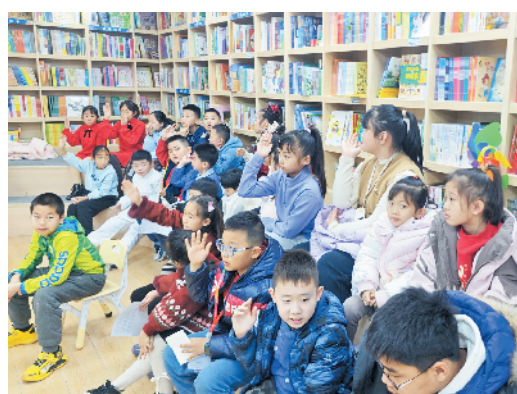
小记者踊跃举手回答问题。