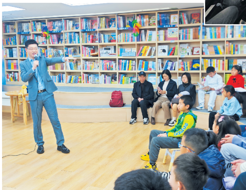
青岛电视台主持人与小记者互动。