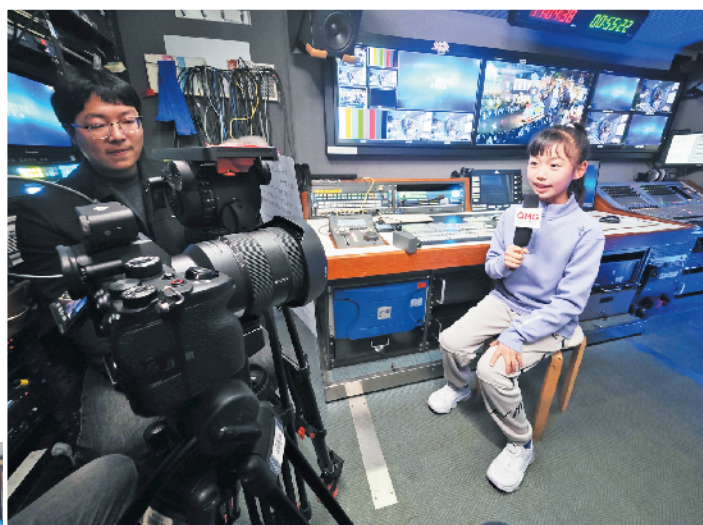
小记者参加录播活动。