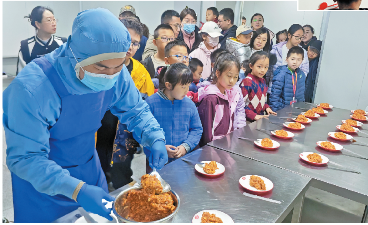
老师现场示范汤包的制作过程。