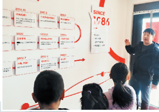
千忆汤包工作人员向小记者介绍“千忆”的发展历程。