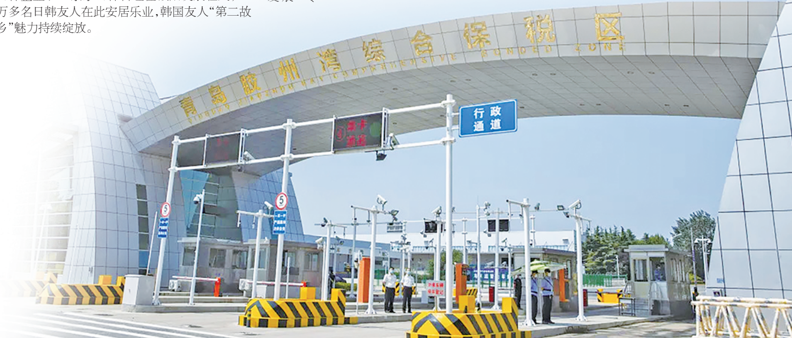
青岛胶州湾综合保税区。

有理有信,在城阳聚力打造轨道交通、集成电路、储能以及低空经济和空天信息“3+1”产业体系的版图上,越来越多的外资企业能看到这片热土的潜力,选择落户扎根、茁壮成长,以实际行动投下“信任票”!