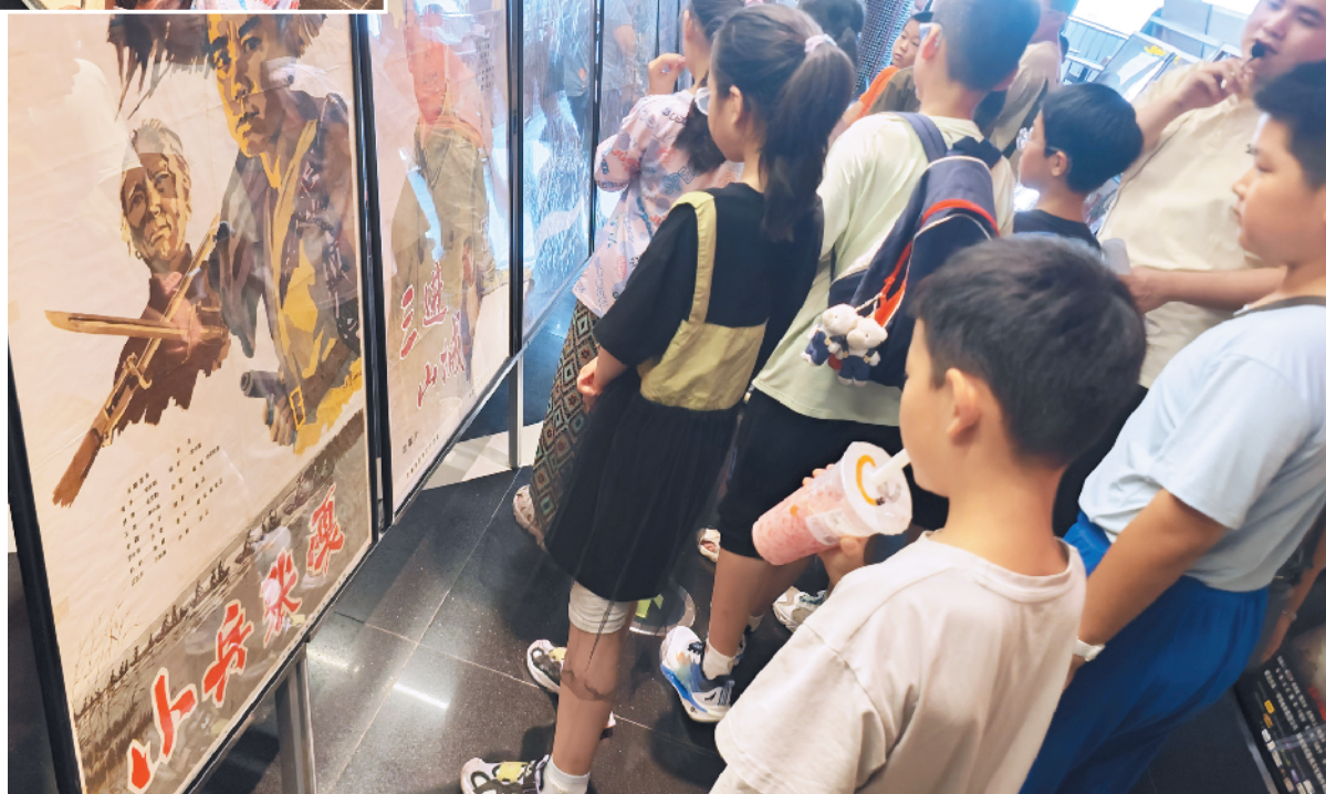
小记者们观看20世纪60年代的电影海报。