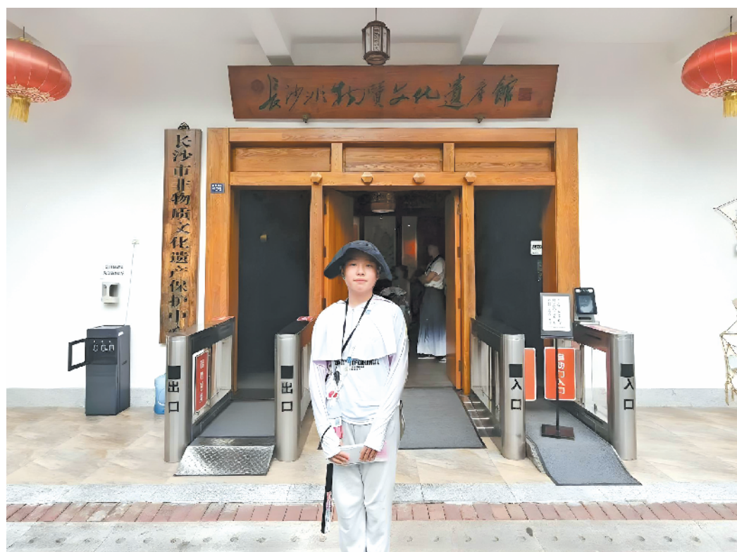
本文作者在长沙非物质文化遗产馆前留影。

这次长沙之行,让我对传承非遗的匠人肃然起敬。如今,我真心祝愿非遗技艺能永远传承,绽放更耀眼的光芒。