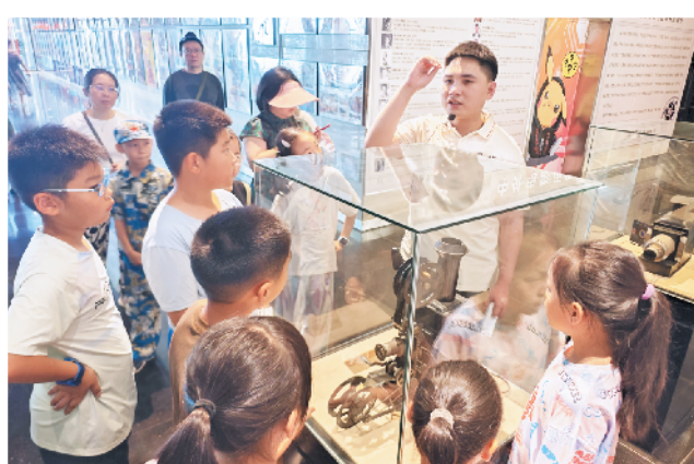
讲解员老师介绍电影放映机工作原理。

近日,青版财经小记者走进青岛星博电影博物馆,参观了馆内“纪念抗战胜利80周年电影海报展”。在200余幅原版海报与斑驳的老式放映机间,小记者开启穿越时空的历史对话,透过光影重温抗战岁月,厚植爱国情怀。