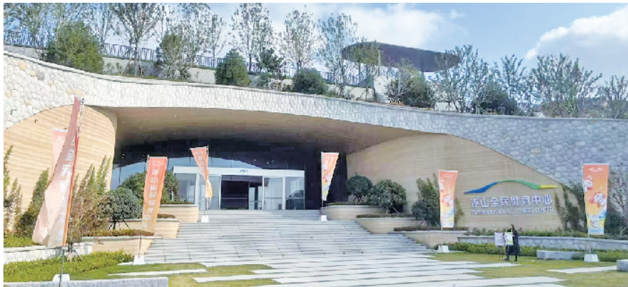
浮山全民健身中心。

这5年,公园城市建设成绩斐然。青岛市先后印发实施《青岛市“十四五”林业发展规划》《青岛市公园城市建设规划(2021—2035年)》,编制《青岛市城市绿地系统专项规划(2021—2035年)》《青岛市自然保护地整合优化方案》,全面推进城乡一体化生态网络建设与保护;超额完成公园城市建设三年攻坚行动“12131”工程,完成荒山造林3.1万亩、森林质量精准提升19.5万亩,复壮古树名木690株、建成古树公园8处,绿化村庄720个,建设城市绿道687公里、林荫廊道313.5公里、立体绿化500处、口袋公园378个、综合公园(社区公园)34个,整治提升71个山头公园,新(改)建造老化公园346个,展现敬老爱老人文关怀。