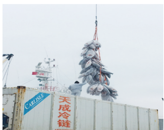
山东中鲁海延远洋渔业有限公司正在装卸金枪鱼。