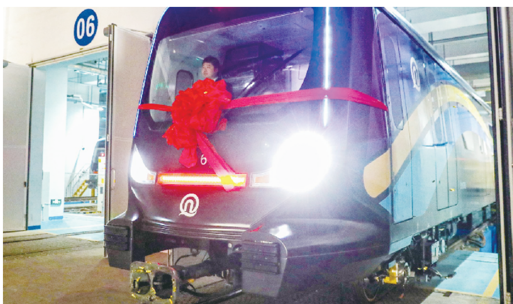
全球首列碳纤维地铁列车在青岛地铁1号线投用。(资料照片)

创新链条。青岛市深化与京津冀国家技术创新中心合作,探索“双中心+离岸孵化器+本地加速器”发展模式;推进中国科学院青岛生物能源与过程研究所、山东能源研究院、新能源省实验室“三位一体”融合发展,产出钙钛矿太阳能电池、硫化物固态电池等前沿技术成果;推动建设北航青岛研究院、浪潮人工智能研究院等一批研发机构重点项目,累计培育省、市级新型研发机构133家;加快30所驻青高校学科专业的优化调整,5年来累计新增147个本科专业点,高校人才培养主阵地、科技创新策源地的作用更加凸显。