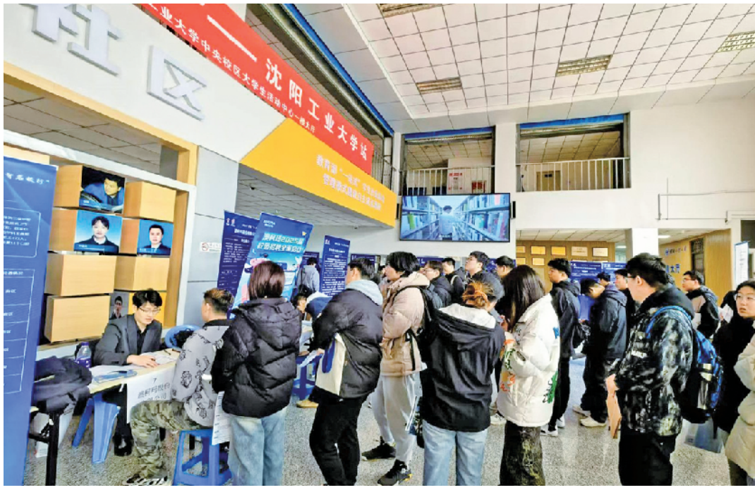
2025年青岛“招才引智名校行”活动现场。