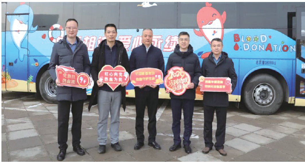
青岛市多个部门的机关干部参加无偿献血活动。

1月16日,青大中心血站市级机关会议中心院内,“海豚号”献血车准时迎来首批献血者。青岛市第27个公务员献血日首场活动正式启动,这一延续多年的公益活动展现出新的时代意义,成为机关党员干部深入践行以人民为中心的发展思想的具体行动。