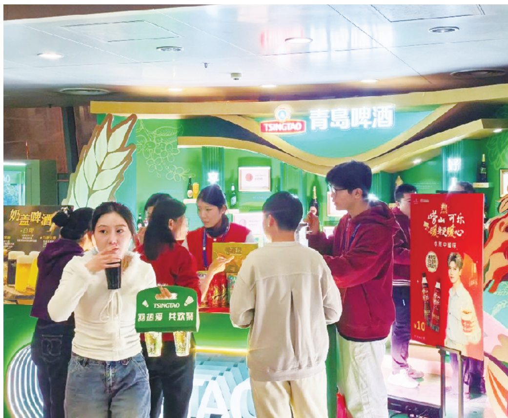
青岛啤酒推出赛事定制无醇饮品,在赛场设嘉年华互动区,打造“微醺观赛”新体验。

青岛本土品牌积极融入赛事生态。青岛食品成为本届亚团赛的指定食品,为运动健儿提供营养保障。青岛啤酒推出赛事定制无醇饮品,在赛场设嘉年华互动区,打造“微醺观赛”新体验。