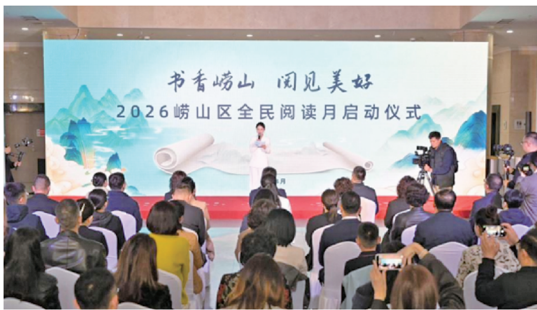
“书香崂山·阅见美好”2026年崂山区全民阅读月启动仪式现场。

接下来,崂山区将推出涵盖品牌引领、空间提升、亲子共读等在内的六大板块、百余项精品活动,通过“月月有精品、周周有活动、日日飘书香”的常态化机制,让阅读真正成为市民的生活方式,为“文化崂山”建设注入持久的精神动力。