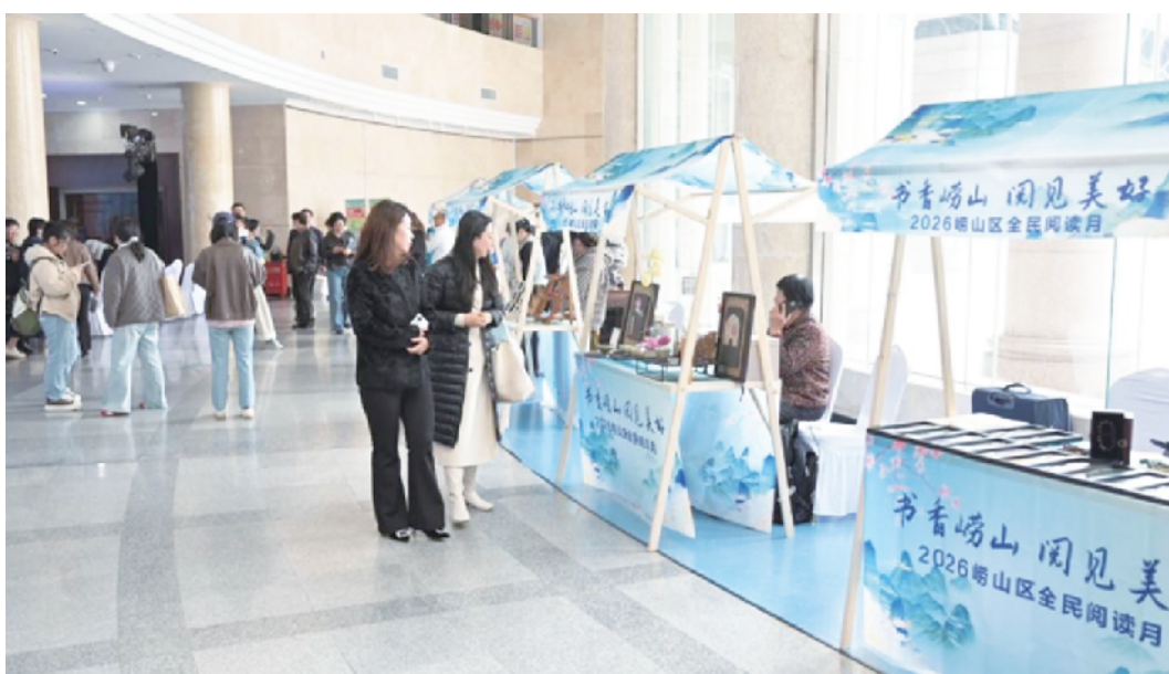
活动当天设置了非遗体验、图书文创等特色市集。